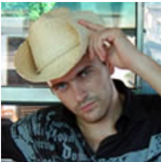
Damslee - 31 ans